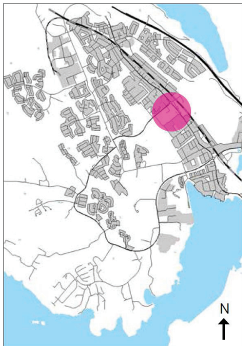
Planområdet ligger mitt i Bålsta med närhet till Mälaren.