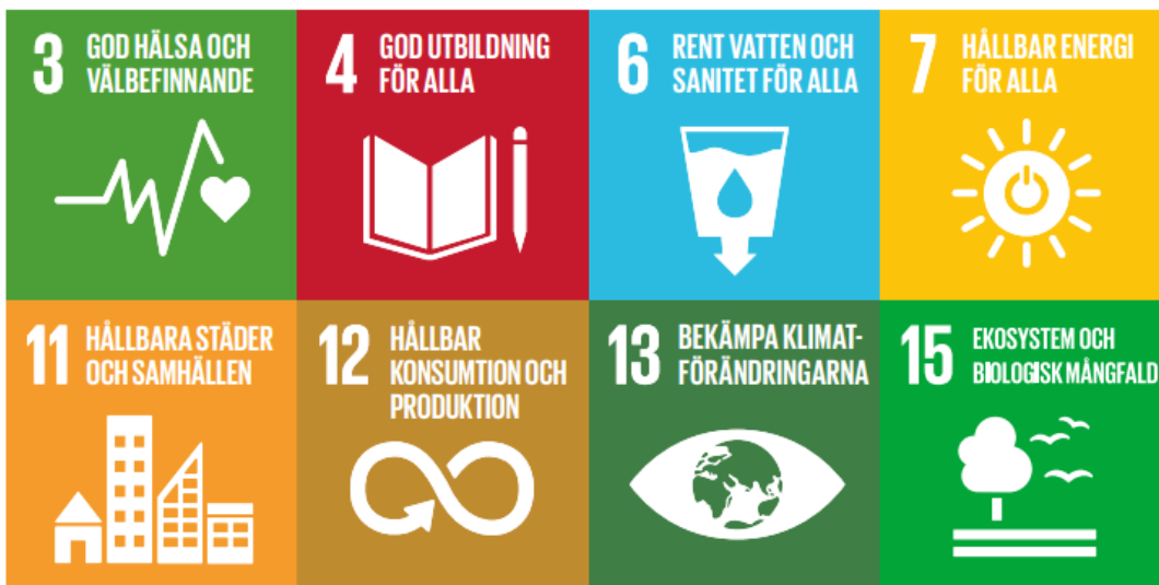
Figur 3. Åtta globala mål som utpekats som mest relevanta i Håbo kommuns hållbarhetsstrategi.

Hållbarhetsstrategin pekar ut åtta globala mål som de mest relevanta för Håbo kommun. Se figur 4. Även om dessa åtta målen är specifikt utpekade så behöver kommunen arbeta med samtliga globala mål eftersom de överlappar varandra.