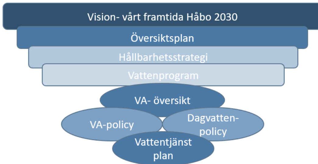
Figur 1. Beskrivning över styrdokument som ingår i kommunens VA-planering

Tidigare VA-plan och dess innehåll ersätts av denna vattentjänstplan i sin helhet och kompletteras med nytt innehåll.